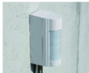
Z natynkową rurką z przewodami