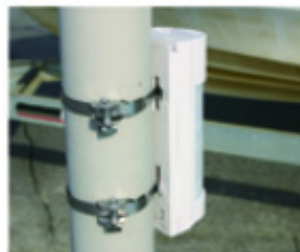
Standardowe taśmy metalowe