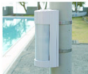
Montaż na słupie