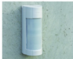
Montaż na ścianie

Cyfrowy antymasking pozwala na prawidłową pracę w trudnych warunkach środowiskowych. W czujce użyto wodoszczelnej obudowy, która pozwala na użytek zewnętrzny i jest odporna na negatywny wpływ promieni UV. Zasilana jest baterijnie i przystosowana do systemów bezprzewodowych . Czujkę można montować bezpośrednio na ścianie (także wraz z przewodami prowadzonymi natynkowo w rurce) lub na słupie (z wykorzystaniem standardowych taśm metalowych). Opcjonalnie dostępny jest czujnik oderwania od podłoża.