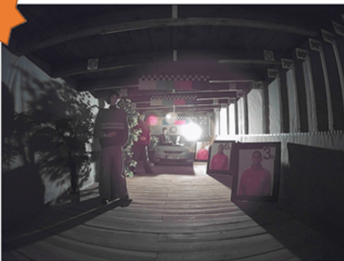
1. Obraz z kamery przy oświetleniu sztucznym (ok. 30 Lux)