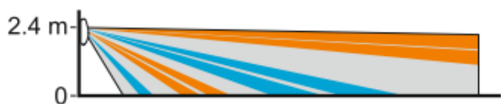
zworka założona – wysoka czułość