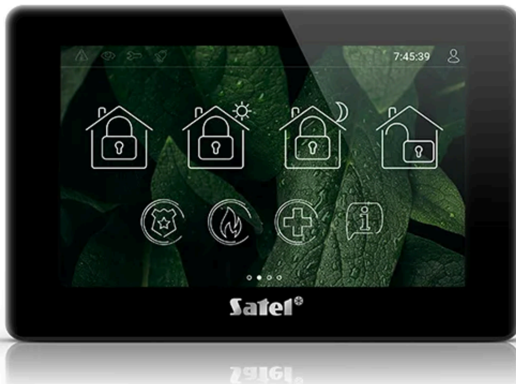
Satel INT-TSH2R-B (kolor obudowy: czarny) to nowoczesny, przewodowy manipulator dotykowy z ekranem