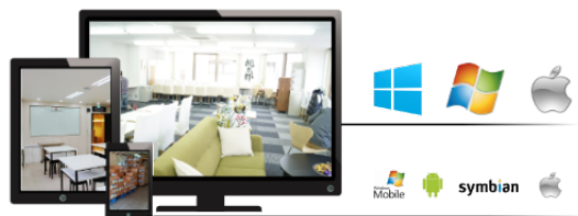
Podgląd z programu CMS