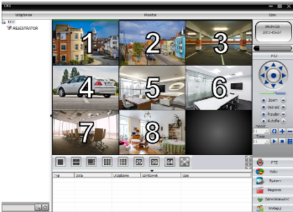
Praca w chmurze (P2P - Xmeye.net)