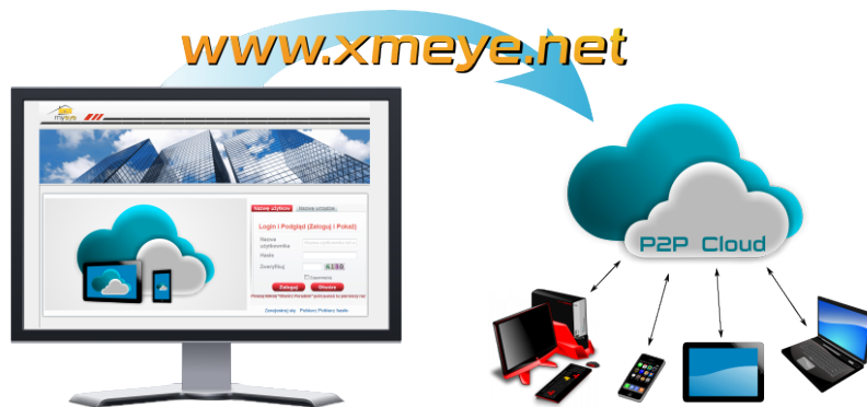
Zdalny dostęp (online)