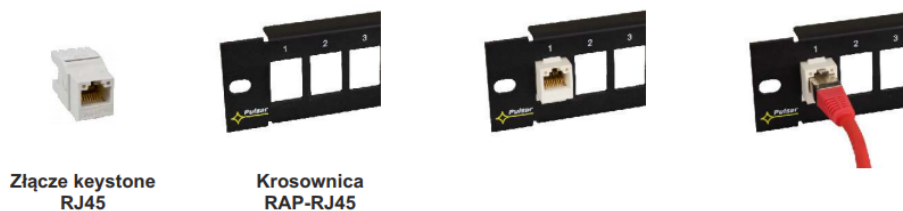
Złącze keystone RJ45