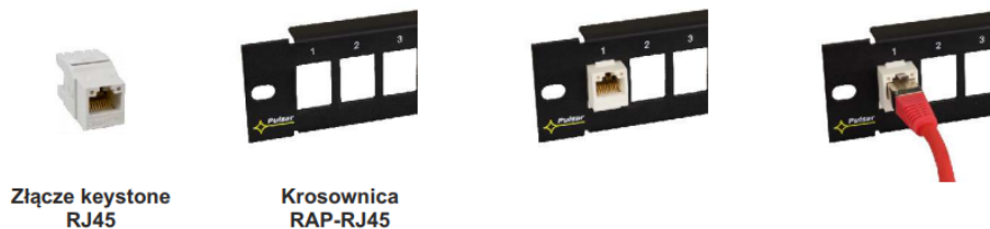
Złącze keystone RJ45