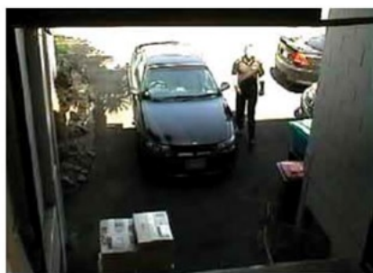
Camera without BLC

Funkcja przydatna w sytuacji, gdy sprzęt ukierunkowany jest na silne światło i pierwszy plan jest zbyt ciemny, przez co też niewyraźny. BLC rozświetla ciemne miejsca, wraz z tłem, dzięki czemu jakość obrazu jest zdecydowanie lepsza.