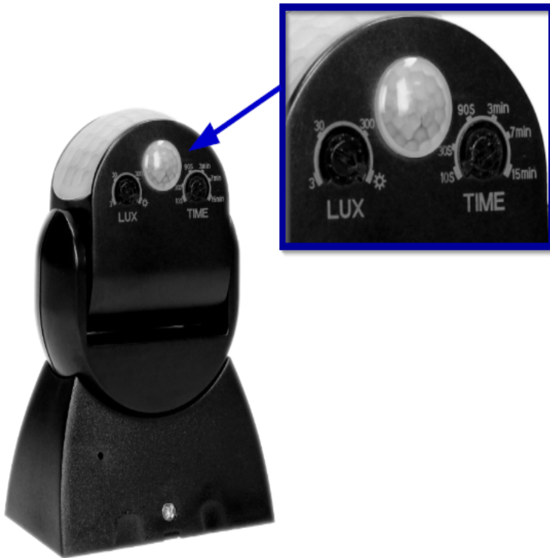
Mechaniczna regulacja w pionie i poziomie